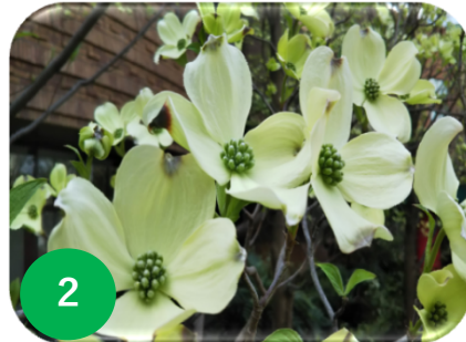
2 ハナミズキ/ミズキ科 (花テラ/緑テラ)