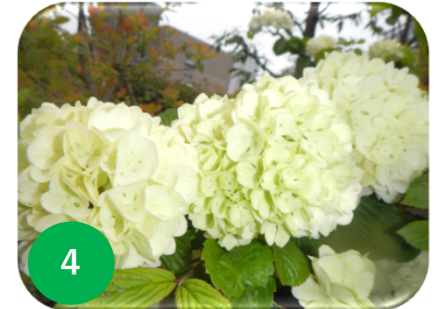
4 オオデマリ/レンプクソウ科 (緑テラ)