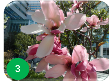
3 モクレン/モクレン科 (ノース)