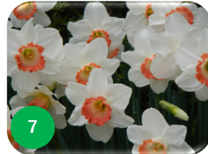
7 西洋スイセン/ヒガンバナ科 (ノース)