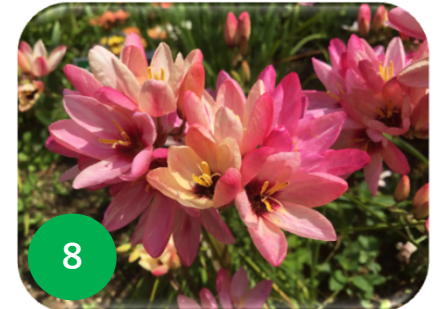
8 イキシア/アヤメ科 (花テラ)