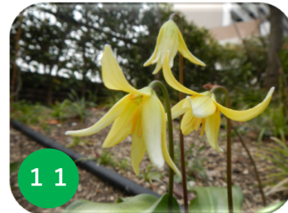
11 黄花カタクリ/ユリ科 (緑テラ)