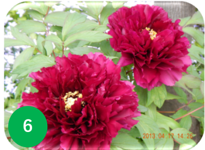
6 ボタン/ボタン科 (花テラ)