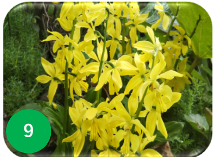
9 黄エビネ/ラン科 (ノース)