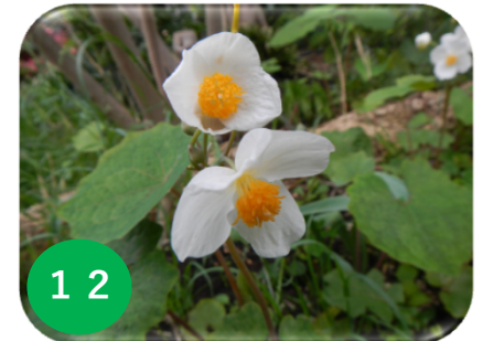
12 シラユキゲシ/ケシ科 (花テラ)