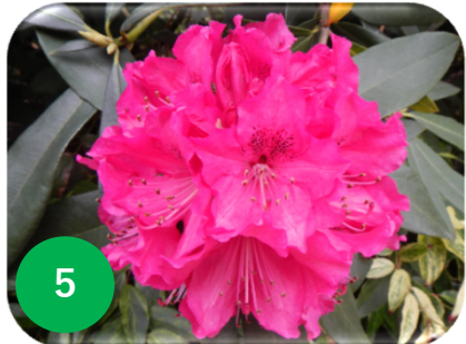
5 西洋シャクナゲ/ツツジ科 (緑テラ)