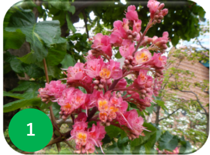
1 ベニバナトチノキ/トチノキ科 (花テラ/緑テラ)

* ( )内は植栽エリア 花テラ:花のテラス/緑テラ:緑のテラス/ノース:ノーストリトンパーク