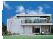
パナソニック ホームズ