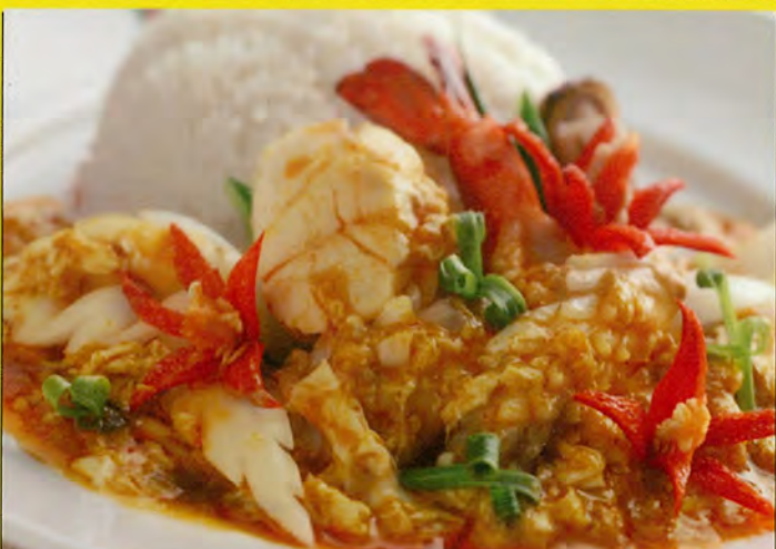
A4 シーフード卵カレー 単品 税込 ¥770