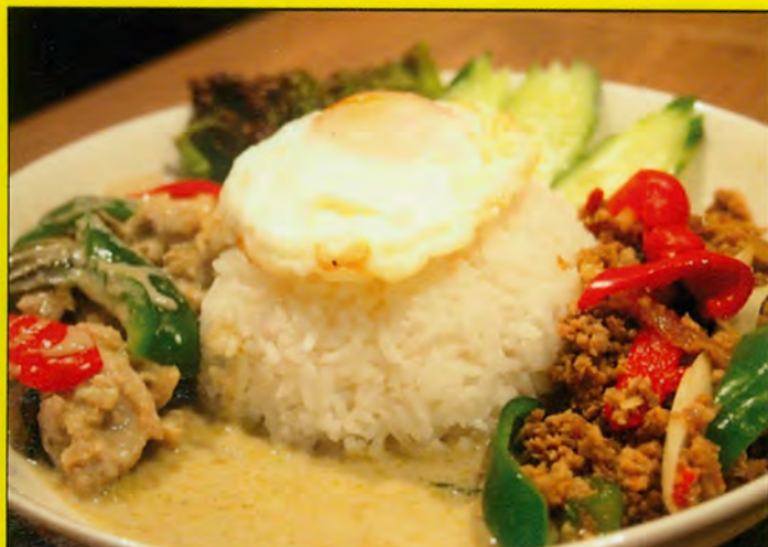
A5 ガバオ&グリーンカレー 単品 税込 ¥850