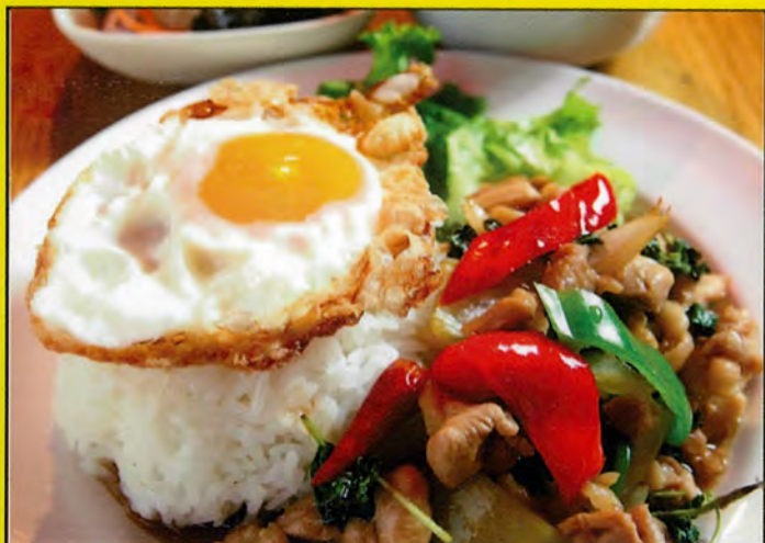
A3 ガバオごはん 単品 税込 ¥720