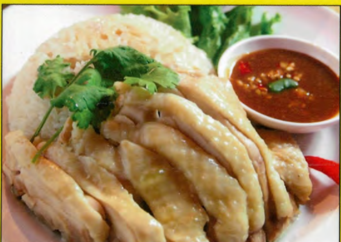
A2 タイ風チキンライス 単品 税込 ¥770