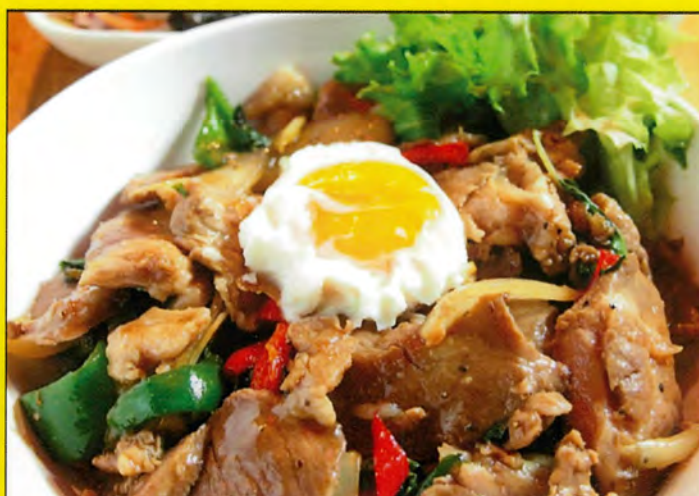
A6 タイスタ丼 単品 税込 ¥800