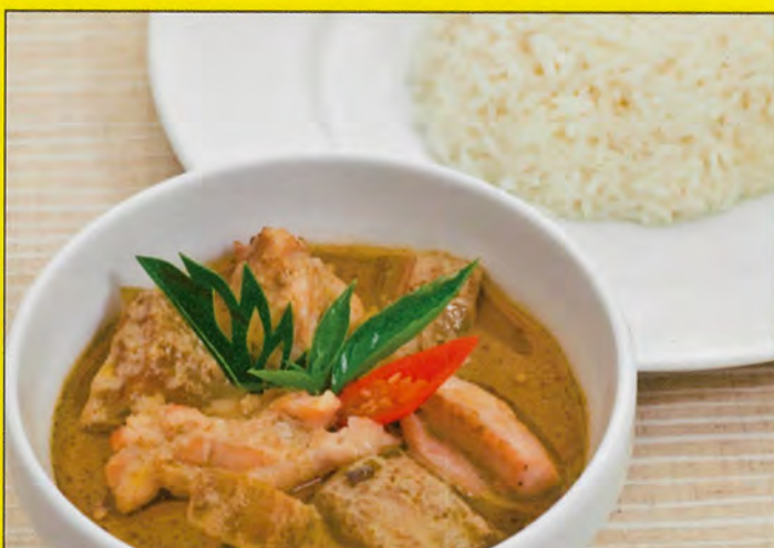
A1 鶏肉のグリーンカレー 単品 税込 ¥720